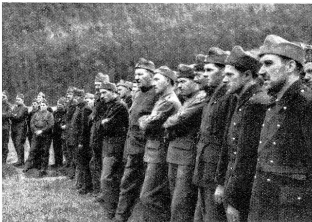
Bild 8. Landsturm-Mitr. beim theoretischen Unterricht über Minenwerfer und Infanteriekanonen

Photo 8. Mitrailleurs du landsturm assistant à une théorie sur le lance-mines et le canon d'infanterie