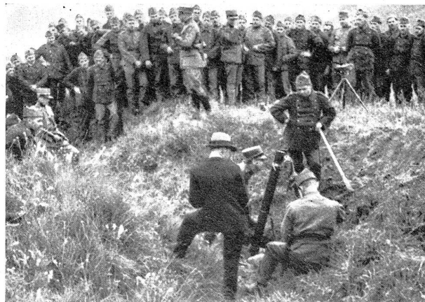
Bild 9. Demonstrationsschießen mit Minenwerfer Photo 9. Tirs de démonstration avec lance-mines