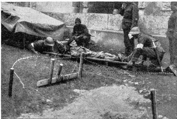
Der Verwundete verläßt die «Sappe». Er wird in Drahtverbau neue Beunruhigung finden. Le blessé vient de sortir de la «sape». Il rencontrera de nouvelles difficultés dans les barbelés.