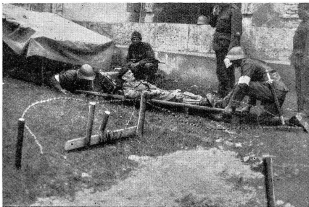
Der Verwundete verläßt die «Sappe». Er wird in Drahtverbau neue Beunruhigung finden. Le blessé vient de sortir de la «sape». Il rencontrera de nouvelles difficultés dans les barbelés.