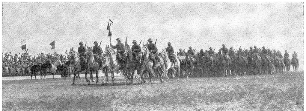
Défilé de la 2 e division La cavalerie