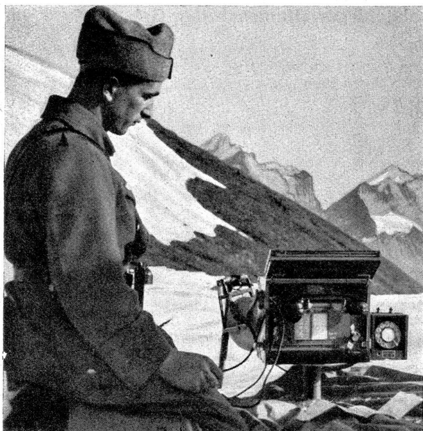
Die Geb.-Tg.-Kp. hatte bis auf die Gitzifurgtge Telefonverbindungen hergestellt

La cp. télégr. mont. avait assuré les communications téléphoniques jusque sur la «Gitzifurgtge»