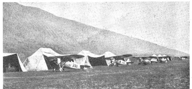
W.-K. der Jagdflieger-Kp. 15 — Auf dem Flugplatz in Biel C. R. de la cp. d'avions de chasse 15 — Aérodrome de Bienne

Oberst Otter ist Schütze mit Leib und Seele , der dem Grundsatz huldigt, daß der Offizier es auch im Schießen seinen Leuten zuvor tun sollte und darnach als Kommandant der Schießschulen handelte und wirkte. Auch um das freiwillige Schießwesen hat er sich bleibende Verdienste erworben und