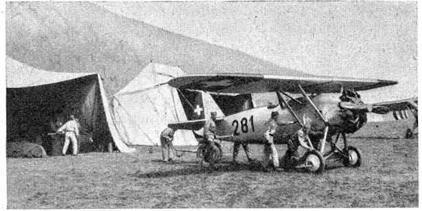
W.-K. der Jagdflieger-Kp. 15 — Ausrücken zum Starten C. R. de la cp. d'avions de chasse 15 — Mise en marche pour le départ

Escadrille militaire suisse au-dessus de la chaîne du Stockhorn Au sujet du livre «Vier Schweizer Flieger erzählen» (Quatre aviateurs suisses racontent)