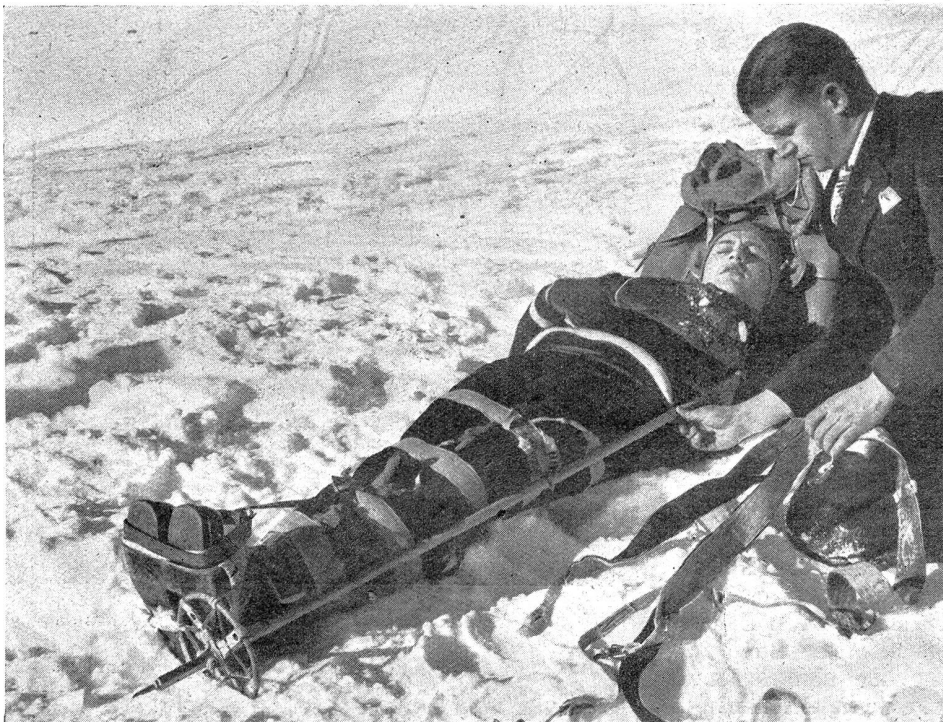
Bild 6. Ohne Fixation kein Transport! Der Verunfallte bleibt an Ort und Stelle liegen, bis man dem gebrochenen Knochen einen Halt gegeben und auch die zwei benachbarten Gelenke ruhiggestellt hat. Dazu sind nötig drei Dinge, die man immer bei sich hat: 1. Polster (Pullover, Reservehandschuhe, Reservesocken, Wäsche). 2. Schienen (das gesunde Bein des Patienten, Skistöcke, Eispickel, Karabiner, Brettchen). 3. Binden (Seehundsfelle, Gürtel, Lederriemen, Wäsche, Hosenträger, Wadenbinden). Die Schuhe werden nicht ausgezogen, die Wadenbinden werden nicht abmontiert.

Mit unserm Aufsatz wollen wir alle Unteroffiziersvereine zu einer wertvollen und interessanten Bereicherung ihres Vereinsprogramms anregen im Sinn des « Engadiner Militärskitages », welchen Offiziersverein Engadin und Unteroffiziersverein Oberengadin alljährlich am zweiten Sonntag im März durchführen. Es hat sich in den genannten Vereinen gezeigt, daß praktische Anlässe, wie Pistolen- und Gewehrschießen, Geländeübungen im Sommer und im Winter, die Mitglieder aller Grade, Altersstufen, Kragenfarben und Achselnummern und die Vereine viel näher zusammenbringen und tiefere Erinnerungen zurücklassen, als bloße theoretische Vorträge in einem verrauchten Saal!