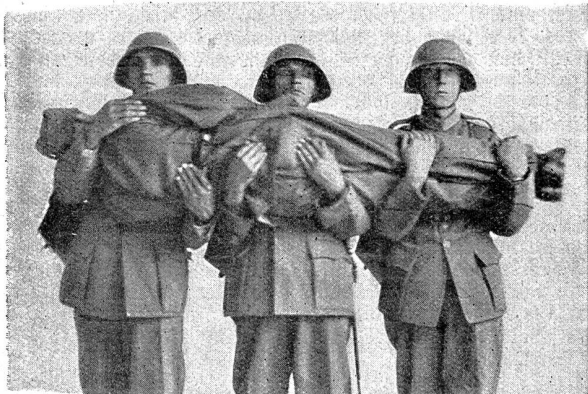
Bild 8. 2. Phase. — Aus dem Lehrbuch für die Sanitätsmannschaft der Schweiz. Armee 1933.

Wird das projektierte Denkmal Hallers diesem Volksempfinden gerecht? Wir sehen da auf einem mächtigen Schlachtengaul eine menschliche Figur, in der ein Uneingeweihter sicher nicht vermuten würde, daß sie einen Kriegshelden darstellen soll. Ist dieser schmalbrüstige Mann mit den heraufgezogenen Schultern und den greisenhaft mageren Oberschenkeln die Verkörperung des mächtigen Hans Waldmann? Wenn es gelten würde, durch diese unmögliche Figur daran zu erinnern, daß der große Zürcher in seiner Jugend nach dem frühen Tode seines Vaters von Verwandten in eine Schneiderlehre geschickt wurde, aus der er bei bester sich bietender