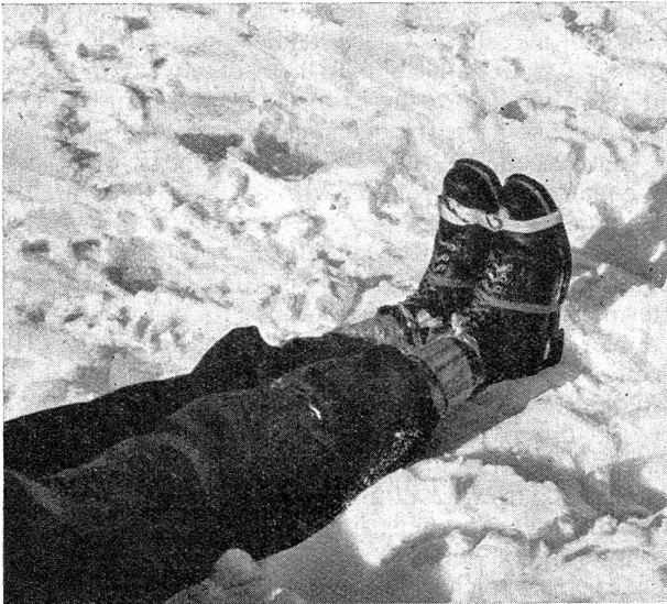
Bild 5. Der verunfallte Fuß wird mit dem gesunden verbunden und durch denselben gehalten. Er kann nicht mehr auswärts rotieren.

Photo no. 5. Le pied blessé est lié à celui qui est intact et est tenu par ce dernier. Il ne peut plus être tourné en dehors.