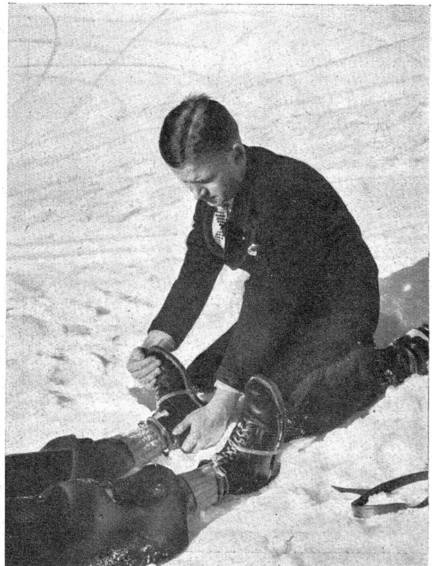
Bild 4. Unter leichtem, gleichmäßigem Zug wird der Fuß langsam richtiggedreht, ohne daß das Bein von der Unterlage abgehoben wird.

Photo no. 4. En le tirant légèrement et régulièrement, tout en le tournant lentement, le pied est remis en place sans que la jambe soit soulevée du terrain sur lequel elle repose.