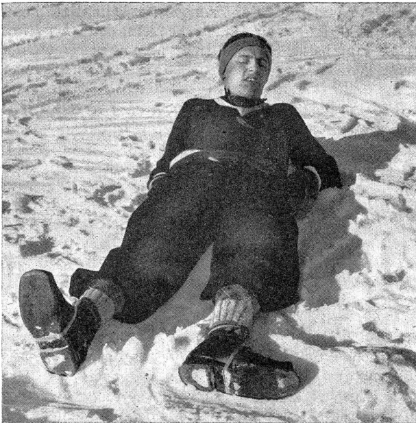
Bild 3. Unterschenkelbruch links, Kniescheibe schaut nach oben, Fußspitze nach außen.

Phot. no. 3. Fracture du bas de la jambe gauche; la rotule regarde vers le haut, la pointe du pied est tournée en dehors.