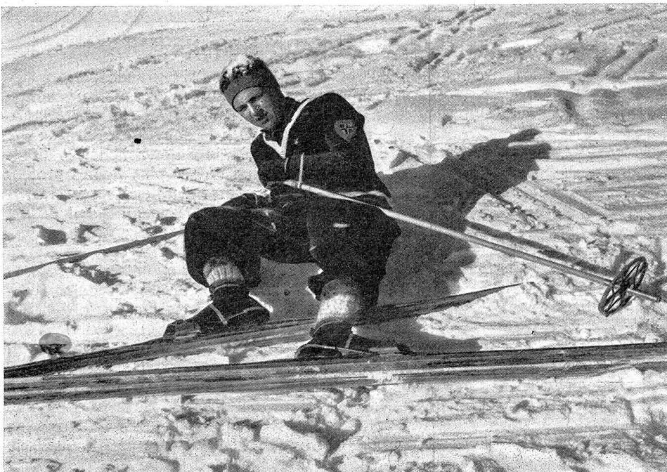
Bild 2 Beinbruch links. Der Verunfallte meldet intensiven lokalisierten Schmerz, er kann sein Bein nicht mehr heben; dasselbe liegt oft in einer unmöglichen Lage und ist ev. geknickt. Skis sorgfältig ausziehen! Bein dabei festhalten, damit es nicht bewegt wird, nicht vom Boden abheben, bevor es geschieht ist. Einer sorgt ausschließlich für das Bein, während der andere die Skis abmontiert.

Bei militärischen Skiunfällen ist ebensowenig wie bei zivilen zu erwarten, daß sofort oder überhaupt in nützlicher Frist ein Arzt oder Sanitätler sich neben dem Verunfallten befindet. Im Krieg und im Frieden müssen seine nächsten Kameraden es verstehen, ihm rasch Hilfe zu leisten, was bei den beim Skifahren so auffallend häufi-