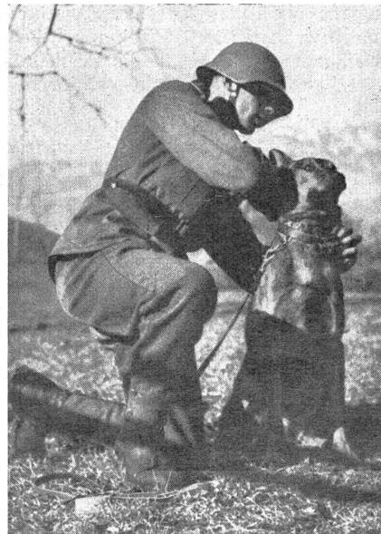
Beim Anziehen der Meldepatrone. La cartouche de liaison est fixée au cou du chien.

Der Ruf nach Befestigungen im Grenzgebiet beginnt sich zu erheben. Bekanntlich hat die Bundesversammlung in der Dezembersession 1933 einen Kredit von vorläufig 6 Millionen bewilligt, um im Rahmen des Arbeitsbeschaffungsprogramms mit der Vornahme von Befestigungsarbeiten einsetzen zu können. Die Vorarbeiten sollen nun beendet sein, so daß mit dem Bau der Werke begonnen werden könnte. Noch ist aber bis heute nichts darüber bekannt geworden, wann die ersten Spatenstiche erfolgen sollen. Daß sich eine gewisse Ungeduld und Besorgnis im Volke zeigt, ist angesichts der heutigen politischen Lage in Europa verständlich. Viele Tausende arbeitsloser Wehrmänner, die, wie wir hoffen, in erster Linie Berücksich-