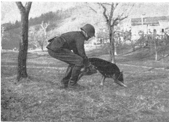
Er wird nach wenigen Schritten von seinem Führer losgelassen. Après quelques pas son guide le lâche.