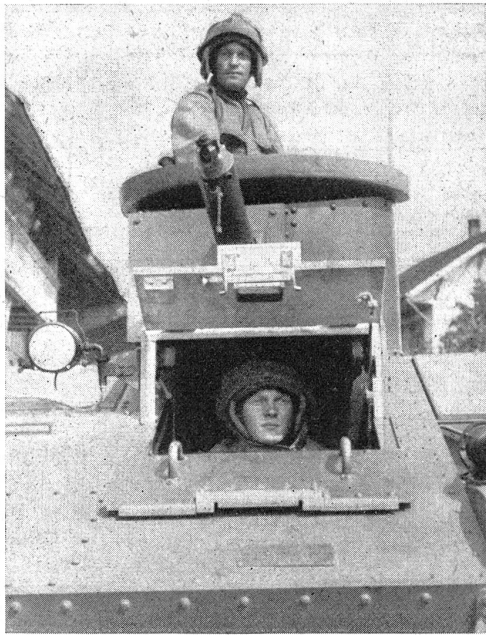
Die Besatzung eines Panzerwagens während eines Vormarsches an den Gegner. Aussichtsklappe des Führers und Panzerturm des Schießenden sind noch geöffnet, an der Aussichtsklappe (unten) ist deutlich die Dicke der Panzerplatten (13 mm) erkennbar.

Les servants d'une auto blindée pendant une avance contre l'ennemi. La fenêtre du conducteur et la tour blindée du tireur sont encore ouvertes. On remarque distinctement vers la fenêtre (dessous) l'épaisseur des plaques blindées (13 mm).