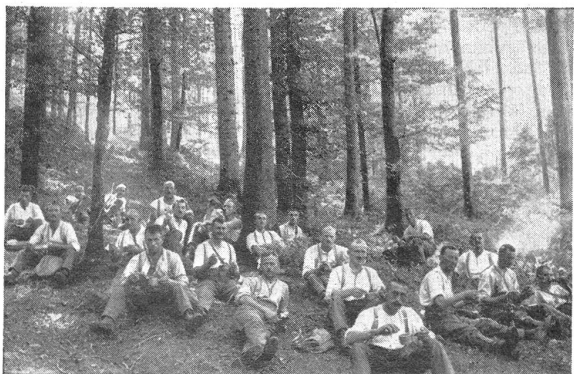
Lw. I.-R. 45 im W.-K. 1934 Soldatenbankett im Buchenwald R. I. Lw. 45 au C. R. 1934 Le banquet des soldats dans une forêt de hêtres

(Korr.) Wenn am Entlassungstage der Rekrutenschule unsere jungen Wehrmänner sich die Frage vorlegen, ob sie zur Lösung ihrer schweren Aufgaben als Soldaten nunmehr genügend ausgebildet seien, so werden ganz allgemein ernste Zweifel wach. Jeder fühlt zwar, daß mit ihm persönlich eine Wandlung vor sich