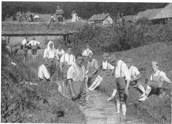
Lw. I.-R. 45 im W.-K. 1934 Phot. Hch. Hohl, Arch Wie wohl tut nach strengem Marsch ein Fußbad R. I. Lw. 45 au C. R. 1934 Qu'il est agréable de prendre un bain de pieds après une marche pénible

Landes » im Jahre 1933 im Gegensatz zu 1932, wo mehr städtische Verhältnisse vorlagen, durchaus nicht das Fehlen der Tuberkulose auf dem Lande beweisen können, wenn auch Zahlenunterschiede vorhanden sind.