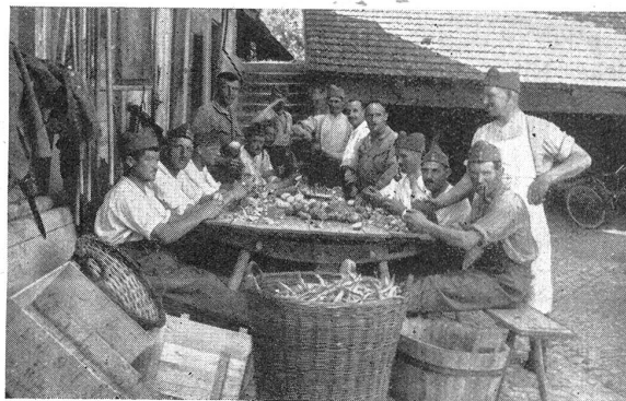
Lw. I.-R. 45 im W.-K. 1934 Das Bankett wird zubereitet. R. I. Lw. 45 au C. R. 1934. La préparation du «banquet»

Dem einen oder andern mag die Frage durch den Kopf gegangen sein, ob es denn nicht möglich gewesen wäre, früher mit der Gefechtsausbildung zu beginnen und die wenig interessante Einzelausbildung dafür etwas früher abzuschließen. Aber wenn man dann die Ergebnisse der Einzelausbildung etwas näher betrachtet, die Handhabung der Waffe zum Schießen und im Gefecht und die präzise Ausführung der Griffe, so muß man er-