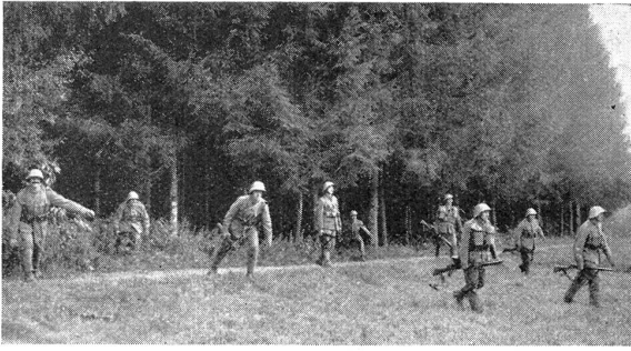
Lw. I.-R. 45 im W.-K. 1934 Lmg.-Gruppe beim Vorrücken aus dem Walde R. I. Lw. 45 au C. R. 1934 Groupe de F. M. quittant la forêt pour prendre position plus en avant