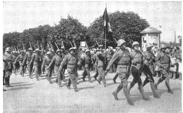
Lw. I.-R. 45 im W.-K. 1934. Defilee in Burgdorf. Phot. Hch. Hohl, Arch R. I. Lw. 45 au C. R. 1934. Le défilé à Berthoud

Die ersten Versuche dieser Untersuchungsart, die sich ganz besonders gegen die Tuberkuloseerkrankung richtet, datieren aus dem Jahre 1923. Durchleuchtungseinrichtungen sind seit 1931 an allen größern Waffenplätzen aufgestellt und seit drei Jahren in Betrieb. Man ist sich bewußt, daß man mit den Durchleuchtungen niemals jeden krankhaften Prozeß erfassen kann, man hofft aber aus der Zusammenarbeit mit den Ergebnissen der Schulkinderdurchleuchtungen eine ärztliche Vorgeschichte zu erhalten, da die persönlichen Aufschlüsse der zur Untersuchung Kommenden häufig im Stiche lassen. « Aus