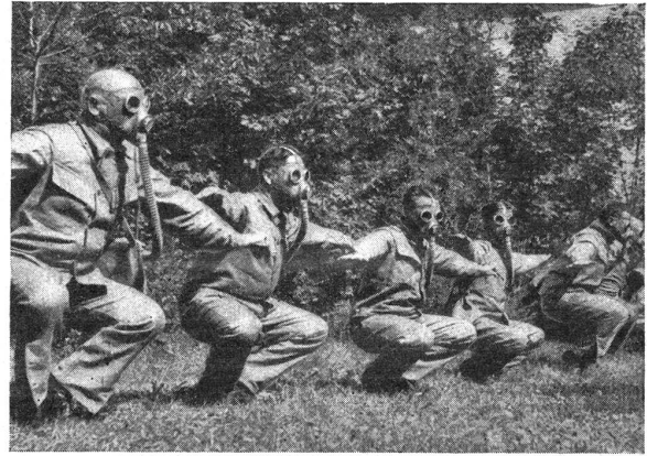
Selbst während ermüdender Arbeit ist die Behinderung durch die Gasmaske durchaus erträglich und hat keinen wesentlichen Einfluß auf die Dauer der Widerstandskraft des Gasmaskenträgers. Même pendant un travail fatigant, la gêne causée par le port du masque est tout à fait supportable et n'a pas d'influence marquée sur la durée de la force de résistance du porteur du masque.

Gleichsam eine Ergänzung zu diesen Nachrichten bildet ein redaktioneller Artikel in der « Neuen Aargauer Zeitung ». Danach soll es ein offenes Geheimnis sein, daß Ende Juli Oesterreich und Italien unmittelbar vor dem Abschluß einer Militärkonvention standen, die eine weitgehende Zusammenarbeit auf militärischem Gebiet zur Folge gehabt und Oesterreich vollends Italien ausgeliefert hätte. Beim geplanten Besuch des österreichischen Bundeskanzlers in Riccione hätte die Konvention unterzeichnet werden sollen. Die Ereignisse des 25. Juli machten aber einen dicken Strich durch die Rechnung. Wohl ging der neue Kanzler Dr. Schuschnigg nach Florenz