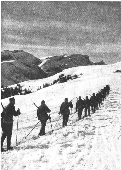
Infanteriezug auf Ski im Aufstieg gegen den Bettelberg, oberhalb Lenk. (Im Hintergrund die Wildhorngruppe.)

Section d'infanterie à ski, pendant la montée au Bettelberg, au-dessus de La Lenk. (A l'arrière plan, le massif du Wildhorn.)