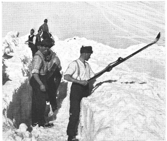
Gebirgsinfanteristen beim Ausheben eines Schützengrabens im Schnee. Mit einem Ski werden die Brustwehren festgeschlagen.

Fusiliers d'infanterie de montagne creusant une tranchée. Les parapets sont fixés solidement au moyen d'un ski.