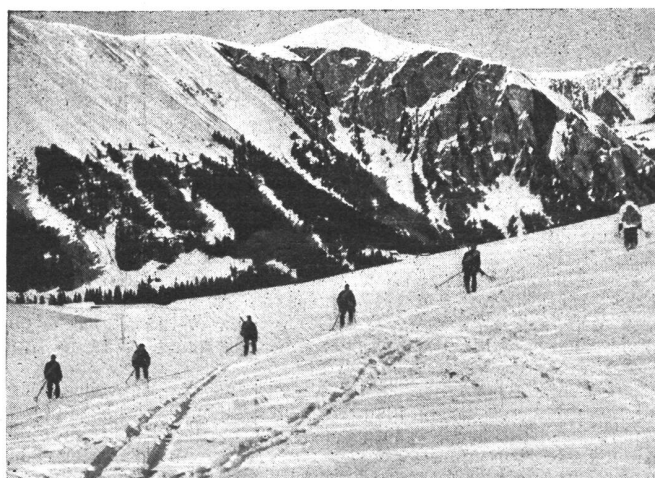
In Schützenlinie vorgehende Skiabteilung. Détachement de skieurs progressant en ligne de tirailleurs. Sezione sciatori in linea di tiratori.

Der Rückblick auf die Geschichte des Sanitätsdienstes im Sonderbundfeldzug ist allgemein sehr interessant, für jeden Wehrmann, gleichgültig welchen Grades, lehrreich und meist nicht sehr erfreulich. Es mußte die Erkenntnis sich erst noch durchringen, daß der verwundete oder kranke Wehrmann der vorzüglichsten Behandlung und Pflege teilhaftig werden muß, einmal weil der Verteidiger des Vaterlandes diese gute Behandlung verdient, ein Recht darauf hat — und dann, weil die Armee ein Interesse an der Wiederherstellung der Gesund-