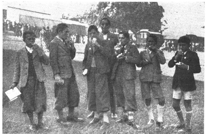
Vom Knabenschießen im Albisgütli-Zürich. Die traditionelle Bratwurst gehört zum Knabenschießen wie der « Bögg » zum Sechseläuten.

A propos du « Knabenschießen » à l'Albisgütli-Zürich. Le « Knabenschießen » a sa traditionnelle saucisse rôtie tout comme le « Sechseläuten » a son « Bögg ».