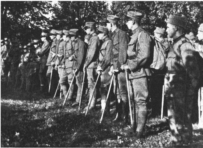
2. Hochgebirgswettmarsch der Geb.-Brigade 9. Bei der Besammlung der Patrouillen am Samstag dem 28. September in Reichenbach.

2 me Concours de marche en haute montagne de la Brig. inf. mont. 9. Pendant la formation des patrouilles le samedi 28 sept., à Reichenbach.