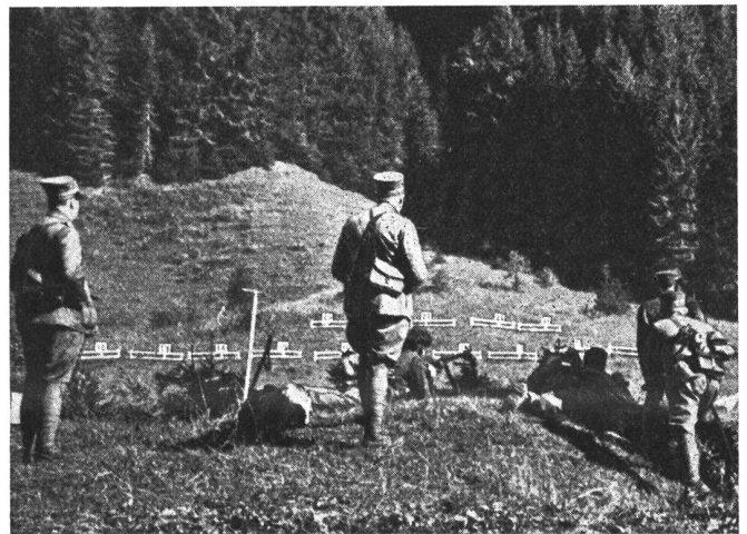
2. Hochgebirgswettmarsch der Geb.-Brigade 9. Auf dem Schießplatz bei Suldtal-Säge. Im Vordergrund einige Offiziere des dortigen Kontrollpostens.

Bei prachtvollem Herbstwetter fand am Sonntag, 29. September, von Reichenbach im Kandertal aus auf der Strecke Kiental, Gornern, Tellipal, Gütsch, Latreien, Suldtal, Reichenbach der zweite Hochgebirgs-Wettmarsch der Gebirgsbrigade 9 (Bern und Wallis) statt, an welchem insgesamt 26 Patrouillen aus den Truppen dieses Heereskörpers starteten. Die Strecke war mit 42 km Länge gegenüber dem Wettmarsch von 1933 um 3 km kürzer, dagegen mußten mit insgesamt 2937 m Steigung, über 300 m mehr als 1933, überwunden werden; zudem war der Parcours allgemein betrachtet bedeutend schwieriger und anstrengender als der frühere. Sämtliche wichtigen Durchgangspunkte waren mit Kontroll- und Sanitätsposten besetzt und durch die von über 30 Pionieren der Gebirgstelegraphen-Kompanie 13 gelegten Feldtelefonleitungen mit dem Kommandoposten Reichenbach