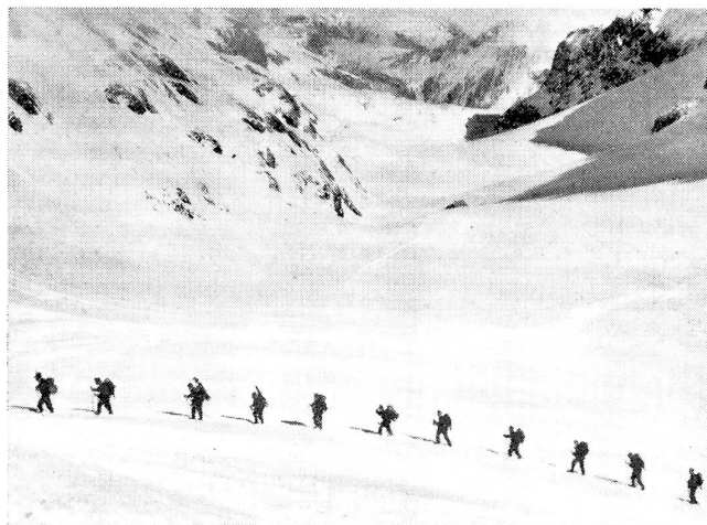
Mg.-Gruppe im Aufstieg durch das Iffigental nach dem Wildhorn. Groupe de mitr. en marche pour le Wildhorn par le wallon d'Iffigen. Gruppo mitraglieri in marcia per il Wildhorn, attraverso l'Iffigental.

Das Buch ist erfüllt von einem geradezu fanatischen Glauben an den Sieg und an die Gewalt der Maschine. Aber hinter der Maschine muß der kämpferische Wille des Menschen stehen, sein Genie, seine Nervenkraft. Es gibt eine technische Phantasie, die mehr überborden kann, als die Phantasie eines Dichters. In diesem geistvollen Buche wird die Maschine vergottet und der Mensch entseelt. Nicht der Mensch, der die Maschine