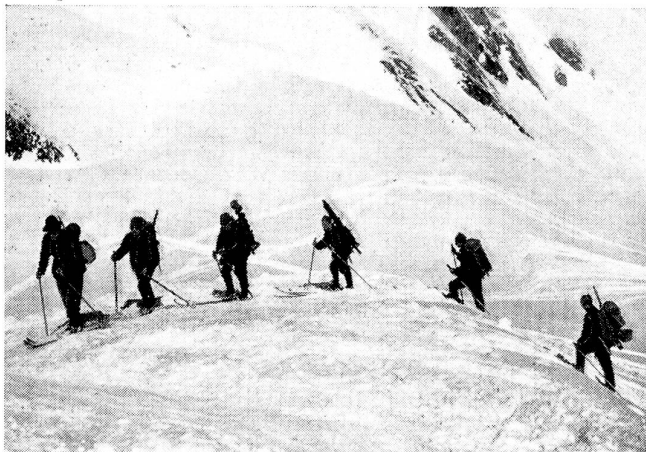
Mg.-Trupp im Aufstieg zum Schneidejoch. Mitrailleurs en marche pour le Schneidejoch. Gruppo in marcia verso Schneidejoch.

Wesen eines Heeres im Widerspruch stehen. Die roten Machthaber scheinen sich davon überzeugt zu haben, daß ohne strengste Disziplin und Unterordnung, ohne Respekt und Achtung vor den Vorgesetzten Kriegsgenügen unerreichbar ist.