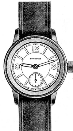
Montre étanche Wasserdichte Uhr

Modèles de montres LONGINES à l'usage des militaires et des sportifs