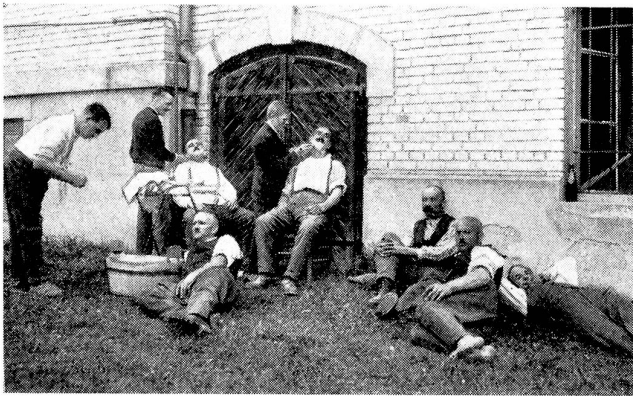
Landwehr im « Salon des Hofcoiffeurs ».

La landwehr au salon du « Coiffeur de la Cour »!