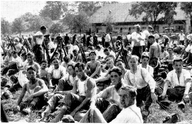
Soldatische Erholungsstunden: Nach anstrengendem Marsch bringt ein längerer Halt die nötige Erfrischung.

Après une marche pénible, une longue halte redonne aux soldats vigueur et bonne humeur.