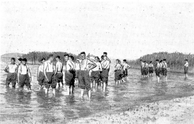
Ein willkommenes Fußbad stellt die Marschtüchtigkeit vollends wieder her.

Bei der Instruktion findet er Verwendung seit 1900. Er bleibt bei diesem schönen Beruf, bis Ende 1936 gesundheitliche Störungen ihn zum Abschiede veranlassen. Abkommandierungen zu andern Waffen, Spezialkurse aller Art, Schiedsrichterdienst usw. geben ihm tiefe Einblicke in das Wesen unserer Armee. So ganz in seinem Element ist er aber hauptsächlich von 1923 an, wo er zum Chefinstruktor der Radfahrerschulen ernannt wird.