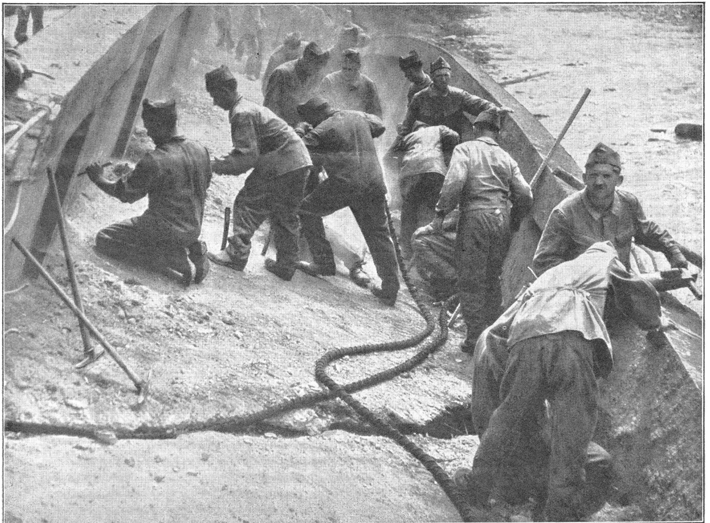
Aus dem Bereich des Mineur-Bataillons. Zerstörung einer Eisenbetonbrücke. Mineure bohren die Sprenglöcher, in die später der Sprengstoff eingebracht wird. Nos Mineurs au travail. Destruction d'un pont en béton-armé. Les mineurs percent les trous de mines pour charger l'ouvrage. I nostri minatori al lavoro. Distruzione di un ponte in cemento armato: I minatori occupati ad eseguire i buchi da mina.