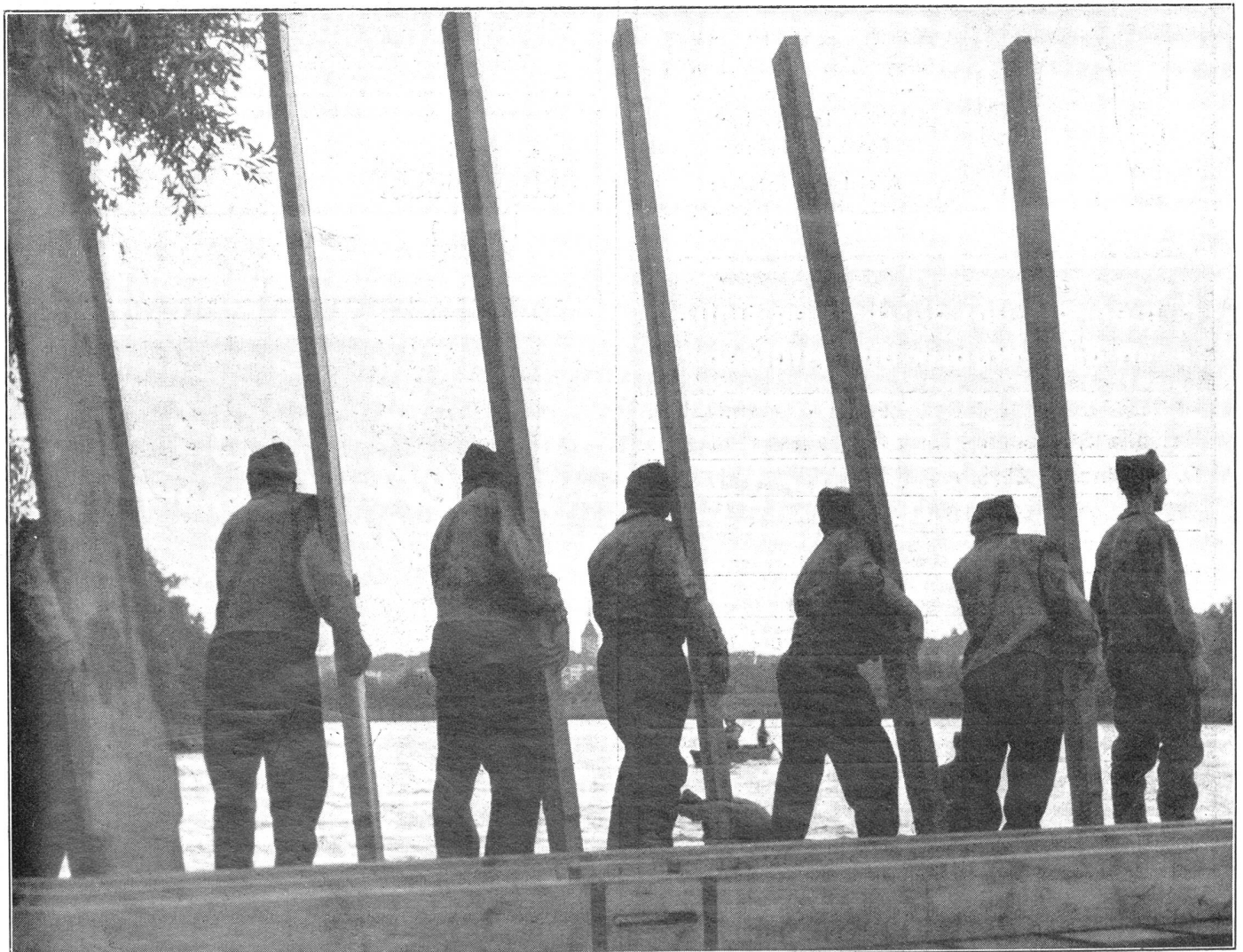
Bau einer Schiffbrücke durch unsere Pontoniere. Der Ladentrupp steht bereit, die starken Brückenladen auf die ausgelegten Streckbalken zu verlegen. Construction d'un pont de bateaux par nos pontonniers. La troupe des madriers est prête à placer les gros madriers sur les poutrelles. I nostri pontonieri alla costruzione di un ponte su barche. Il gruppo designato pronto alla posa di solidi assi sulle traverse del ponte.