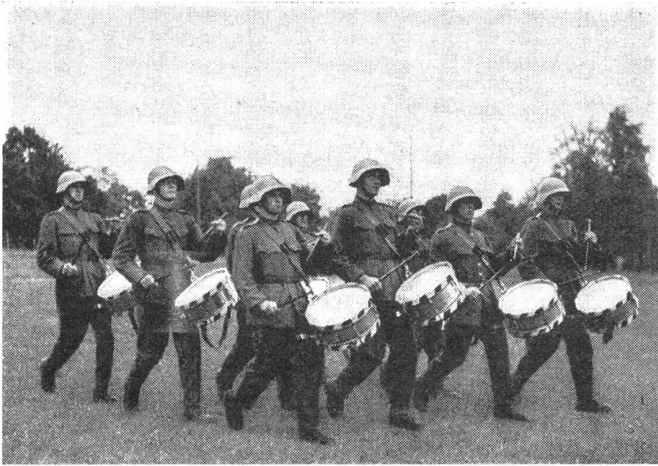
Marschübung der Tambouren auf dem Exerzierplatz. Marche d'exercice de tambours sur la place d'exercice. Esercizio di marcia sulla piazza d'armi.