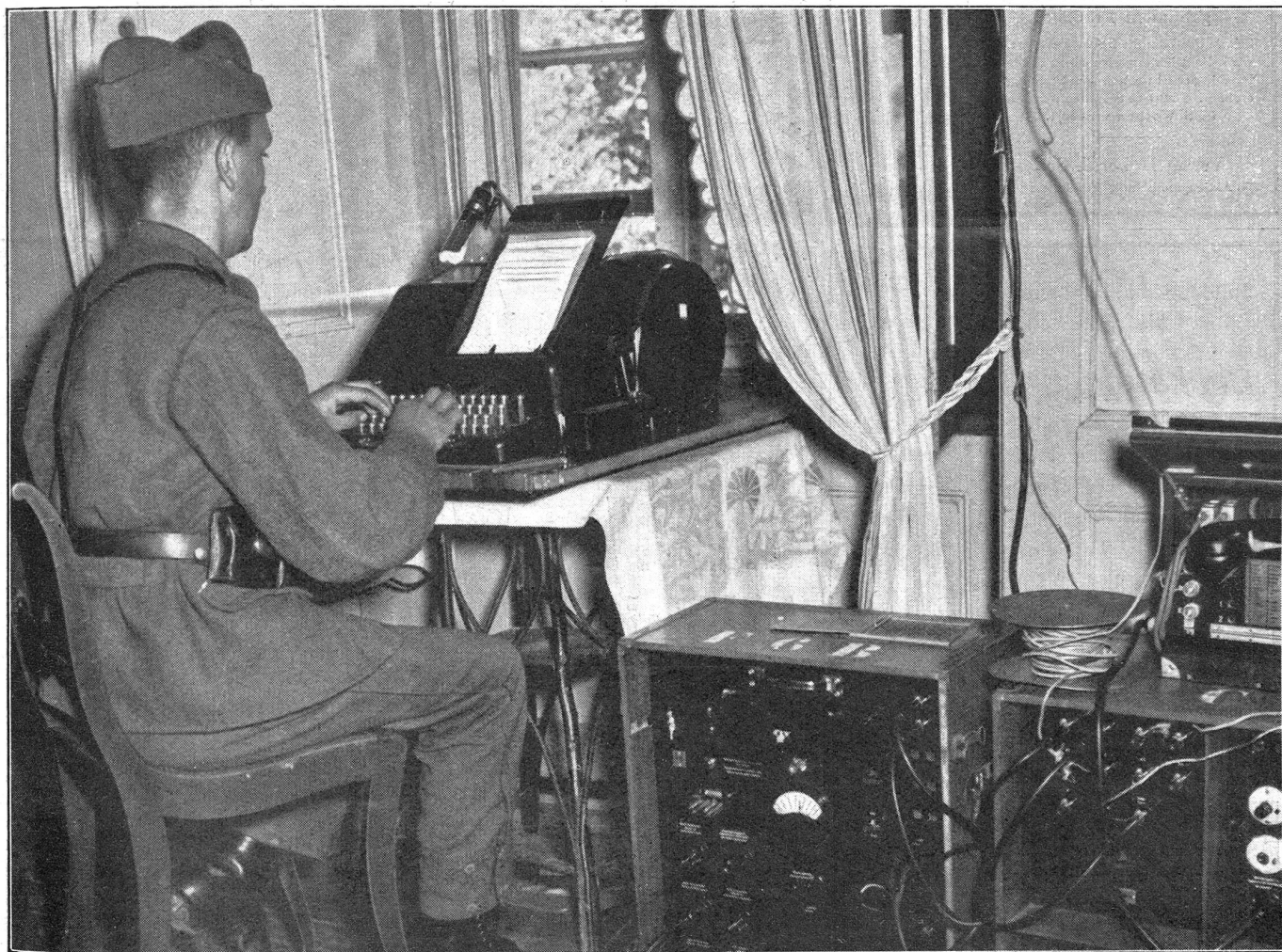
TL-Station im Betrieb. Telegraphen-Pionier am Schreibtelegraphen (Fernschreiber). Station de télégraphe en action. Pionnier-télégraphiste au travail (télé-imprimeur). Stazione telegrafica militare. Pionieri telegrafisti al lavoro.