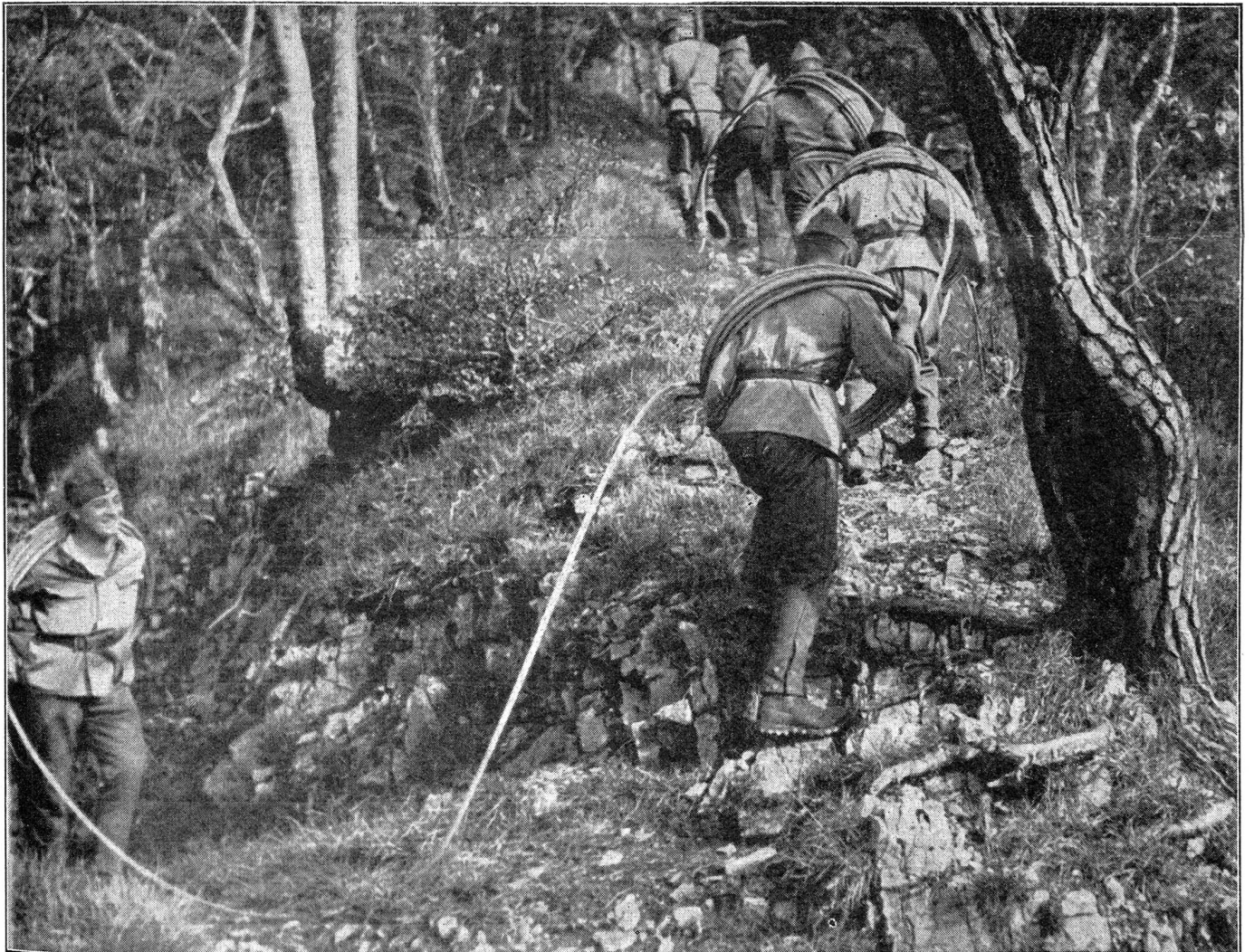
Bau einer militärischen Seilbahn. Transport eines Tragsseiles zur Bergstation, von wo aus das Seil auf die ganze Strecke der Bahn ausgelegt wird.