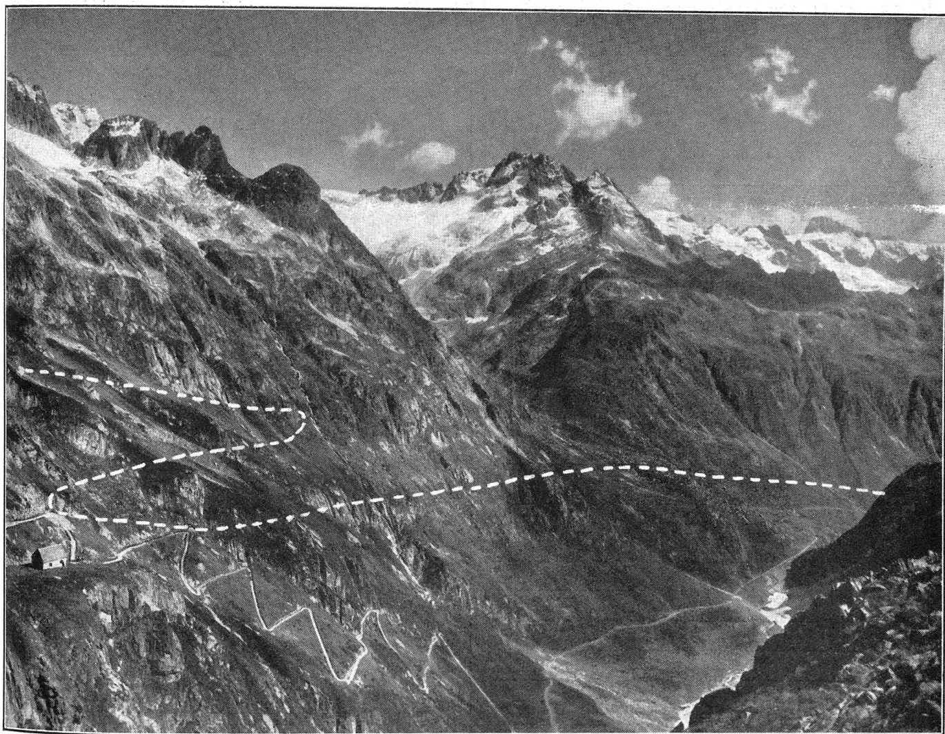
Die kommende Straße über den Sustenpaß. Blick auf die Ostrampe des Sustenpasses zwischen Paßhöhe (links) und Hinterfeldalp, 1660 m (rechts). Die punktierte Linie gibt die ungefähre Straßenführung der neuen Fahrstraße an, die in diesem Teilstück wesentlich von dem gegenwärtigen Sträßchen abweicht. Im Hintergrund links die Fünffingerstock-Wasenhorn-Gruppe, in der Mitte die Wichelplankstock-Gruppe und rechts Klein Spannort-Gwächten-Gruppe.