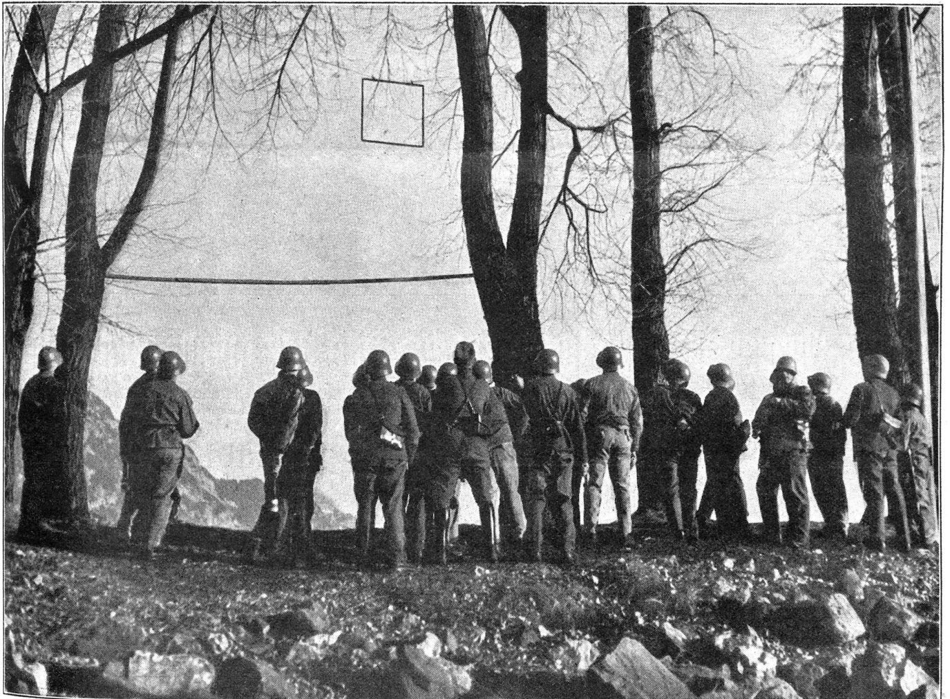
I. Zentralkurs für Handgranatenwerfen 1939 in Wallenstadt. Eine Klasse beim Zielwurf mit Handgranaten in ein durch Metallrahmen markiertes Fenster. Ier cours central 1939 de lancement de grenades à main, à Wallenstadt. Une classe s'exerçant au lancement de grenades dans une fenêtre figurée par une cadre en métal. Il primo corso centrale del 1939 a Wallenstadt per il lancio delle granate a mano. Una classe al lancio delle granate entro una finestra marcata da telaio in metallo.