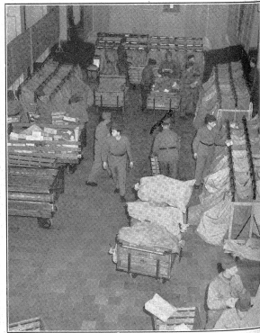
Gesamtansicht eines Paketsortierungsraumes eines größeren Sammel-Feldpostamtes. Vue générale de la salle de triage dans un grand office collecteur de la poste de campagne. Veduta generale di un posto di smistamento di pacchi di un grande ufficio postale militare collettore.