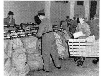
Alsdann erfolgt die Feinsortierung der Pakete direkt in die in einem Gestell aufgehängten Postsäcke für die einzelnen Städte und Einheiten. La tri principal des paquets dans les sacs postaux des unités et états-majors. Segue lo smistamento definitivo dei pacchi per gli Stati maggiori e per le unità in appositi sacchi postali.