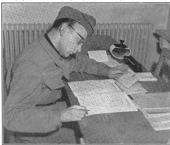
Die Umadressierung der für entlassene Truppen bestimmten Postsendungen erfolgt an Hand der der Feldpost übergebenen Mannschaftskontrollen und nimmt sehr viel Zeit in Anspruch. Le changement d'adresse sur les paquets destinés aux troupes licenciées d'après les contrôles d'hommes et listes d'adresses exige beaucoup de temps et de patience. La ritrasmissione degli invii postali ai militari licenziati richiede molto tempo e grande fatica. Vengono consultati i controlli degli uomini consegnati dalla troupe alla posta da campo.