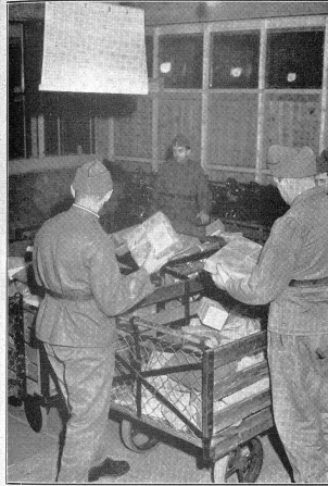
In der Vorsortierung werden die Pakete nach den Hauptleitronten (auf dem Plakat in der Bildmitte oben) in verschiedene Postkarren verteilt. Le tri préliminaire des paquets s'effectue par ordre de voie d'acheminement dans les différentes charrettes postales. Per lo smistamento dei pacchi si procede dapprima alla loro ripartizione sui diversi carrelli postali che li indirizzano alle strade d'avvio principali.