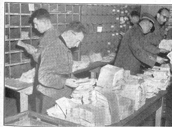
Sehr groß ist die Zahl der von der Truppe abonnierten Zeitungen; sie werden von den Druckereien bereits nach Postzonen sortiert eingeleifert. Bien des soldats sont des abonnés de journaux. Les imprimeries les livrent à la poste déjà triés par zones postales. Il numero dei giornali cui la troupe è abbonata è oltremodo grande. Le tipografie forniscono gli abbonamenti già smistati per avvisi postali.