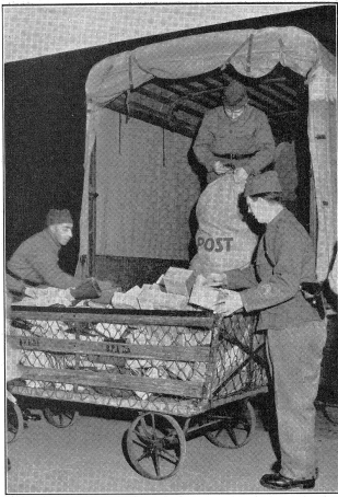
Die für die Truppe bestimmten Postsendungen werden von den größeren Zivilpostämtern an Sammel-Feldpostämter überführt. Les envois postaux destinés à la troupe sont remis par les offices postaux civils à des offices collecteurs de la poste de campagne. Le speditzioni destinate alla troupe vengono mandate dagli uffici postali civili principali agli uffici militari collettori.