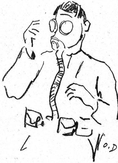
LA MASCHERA: Disegno del fuc. O. Dickmann, Ascona.

Il fugin sta bene. Ti dico però che diventando grande diventa un poco prepotente. Dice sempre no ancora prima che io gli dico di fare una cosa. Quando casca e si fa male e gli dico: Ti sei fatto male? Dice: Nooo! E guai se si insiste. Se gli dico: Andiamo a letto che è l'ora; dice: Nooo! E bisogna portarlo di peso. Se gli dico: Mettiti il piccolo paltò