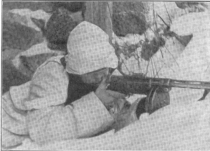
Bild Nr. 2: Finnischer Infanterist mit der Maschinenpistole System Suomi. Diese Waffe ist ein Rückstoßlader von 9 mm Kaliber, wiegt 4,6 kg und besitzt eine theoretische Feuergeschwindigkeit von 800 Schuß pro Minute. Die Munitionszufuhr erfolgt aus Trommeln zu je 70 Schuß.

A sinistra: Atterraggio forzato di un aeroplano russo in una foresta a nordest del lago Ladoga.