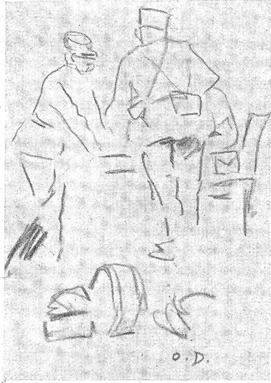
MOMENTO IMPORTANTE: il foriere si accinge a distribuire il soldo... (Disegno del Fuc. O. Dickmann, Ascona.)

Inviare barzellette, poesie, disegni, ritratti, fotografie al FUC. ORTELLI PIO MENDRIGIO