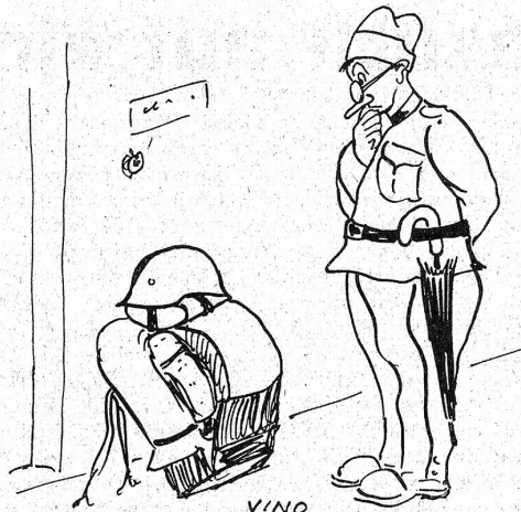
Der zerstreute Professor soll einrücken! „Wäni jetzt nu na wüfsti, für was i die Sach zwäggmacht han?“

«Was suecht Dir so spät i d'r Chammer inne?» Doch unser «Sünder», der Situation gewachsen, fragte leise: «I ha nume welle frage, ob mir d'r Wecker für am Morge chönnte ha!» Pionier «Vino».