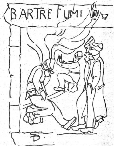
Il rinomato «Bar Tre Fumi». (Disegni del Fuc. D. Saporiti.)

Qualche volta si esce, è vero, in escandescenze: se il vento è troppo gelido, se un sasso è troppo duro da spaccare... ma poi si impara una cosa: che il miglior modo di difendersi dagli impulsi è di scoppiare in una bella grossa risata. Cosa che facciamo spesso. Con ciò ti saluto.