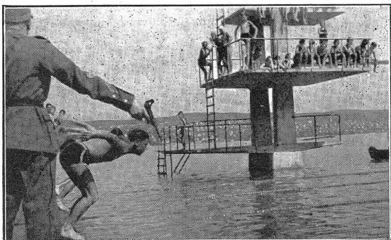
VI H 4912

auch die sportliche Tätigkeit unserer Soldaten wieder mehr zur Geltung. Sport nicht zur Unterhaltung oder als Spiel, sondern als kämpferische Leistungsprobe und Einsatzprobe . So führte in der zweiten Juliwoche eine stadtzürcherische Stabskompanie einen Fünfkampf durch, an dem sich 30 Soldaten, Unteroffiziere und Offiziere beteiligten. Alle in einer Stabskompanie vereinigten Waffengattungen und Spezialisten waren dabei beteiligt: Kanoniere der Minenwerfer und Infanteriekanonenzüge, Sanität und Train, Nachrichtenzug und Gas-trupp, Spiel und Magaziner. Neben 28 Wettkämpfen im