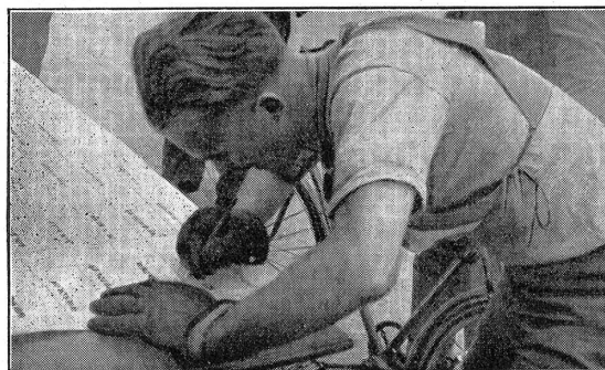
VI H 4914

die Konkurrenz im Radfahren mit Einzelstart über eine reine Straßenstrecke von 32 km mit rund 300 m Höhendifferenz in den Tälern der Limmat, der Reppisch und am Mutschellenpaß. Den Ausgleich zu den vier sportlichen Konkurrenzen bildete das militärische Schießen auf zehn, je 6 Sekunden sichtbare Feldscheiben, Distanz 200 m, wobei drei Schützen das Maximalresultat von zehn Treffern erzielten. Anschließend an das Hauptverlesen fand die Rangverkündigung statt, und von einem reichen Gabentisch, den Gönner und Angehörige der Kompanie inzwischen gebildet hatten, konnten den Besten im Gesamtklassement und in den einzelnen Disziplinen schöne Ehrenpreise von teilweise bleibendem Wert verabfolgt werden. Jeder Teilnehmer erhielt außerdem eine künstlerische Urkunde als Leistungsausweis und bleibende Erinnerung.