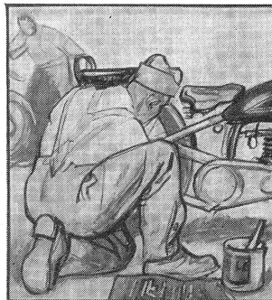
Aber der motorisierte Soldat findet's grad so lustig, wenn er seinen „Göppel“ putzt, und überall schaut er nach, wo man tanken kann.