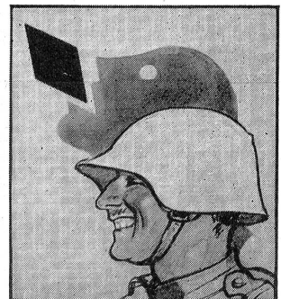
Er sollte Gaba tanken! Gaba schützt vor Heiserkeit und hält die Stimme klar.