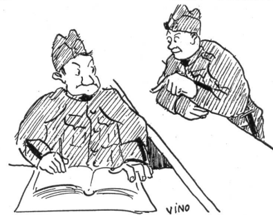
Anmeldung im Komp.-Büro Der „Zivilischt“: Isch bi Eu vilicht na e Strohburdli frei?

Bat.Fus. 20. (Einseigne suisse du début du XVI e siècle.) Prix de vente 25 cts, pièce et 1 fr. le bloc de quatre. Commandes au Cdt. Bat.Fus. 20 en Campagne.