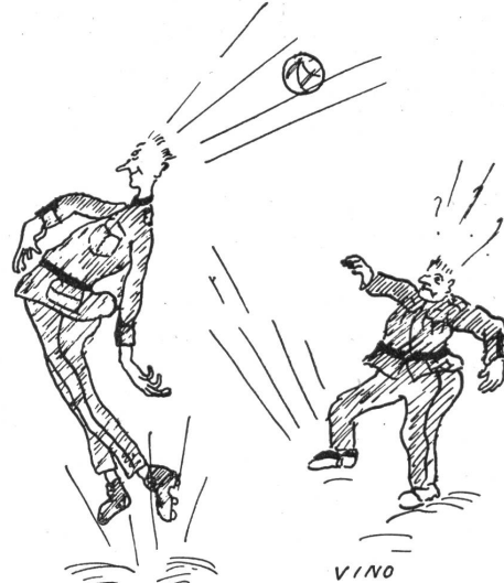
Von unserer Fußballmannschaft: Der Stratosphärengooli!