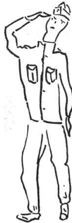
SCUOLA RECLUTE. Ispezione del saluto.

Non oggi. c) Osso, in dialetto. — Superficie. — Dubita. d) Sembra. — Preposizione francese. — Prima del nome dei santi. e) Egli. — Nome di donna strano, vuol dire oziosa in greco. f) Blocco che cade. — Dubita. g) Olio in tedesco. — Sovrano. — Nome di donna biblica. h) Nota musicale. — La centrale di una società. — Pezzo di legno, in dialetto. i) Moneta giapponese. — Parti della mano. l) Malattia del basso ventre. — Paesello sul lago di Lugano, ma non svizzero.