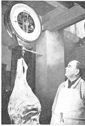
BERKEL-Waage in Metzgerei