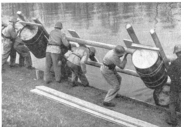
Das erste Floß klatscht ins Wasser.

diesen Befehl. Dann aber waren sie nicht mehr zu halten. Die letzten Spuren von Schlaf, Staub und Spinnweben aus dem Gesicht gewischt. Harte Fäuste packen die Geschütze. Nach vorn! Unaufhaltsam pflügen sie durch den nächtlichen Wald. Da eine Schramme, dort ein Riß, der Mann zwischen den Spreizen stolpert, schlägt der Länge nach hin, die Mannen am Geschütz fliegen zur Seite — Flüche, Verwünschungen —, aber vorwärts, nach vorne — unaufhaltsam — die schweren Waffen kennen kein Hindernis.