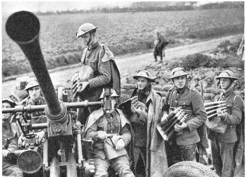
Englische 40 mm automatische Flab-Kanone.

3. Großes Richtfeld, d. h. das Geschütz muß ohne Bewegungen der Unter-