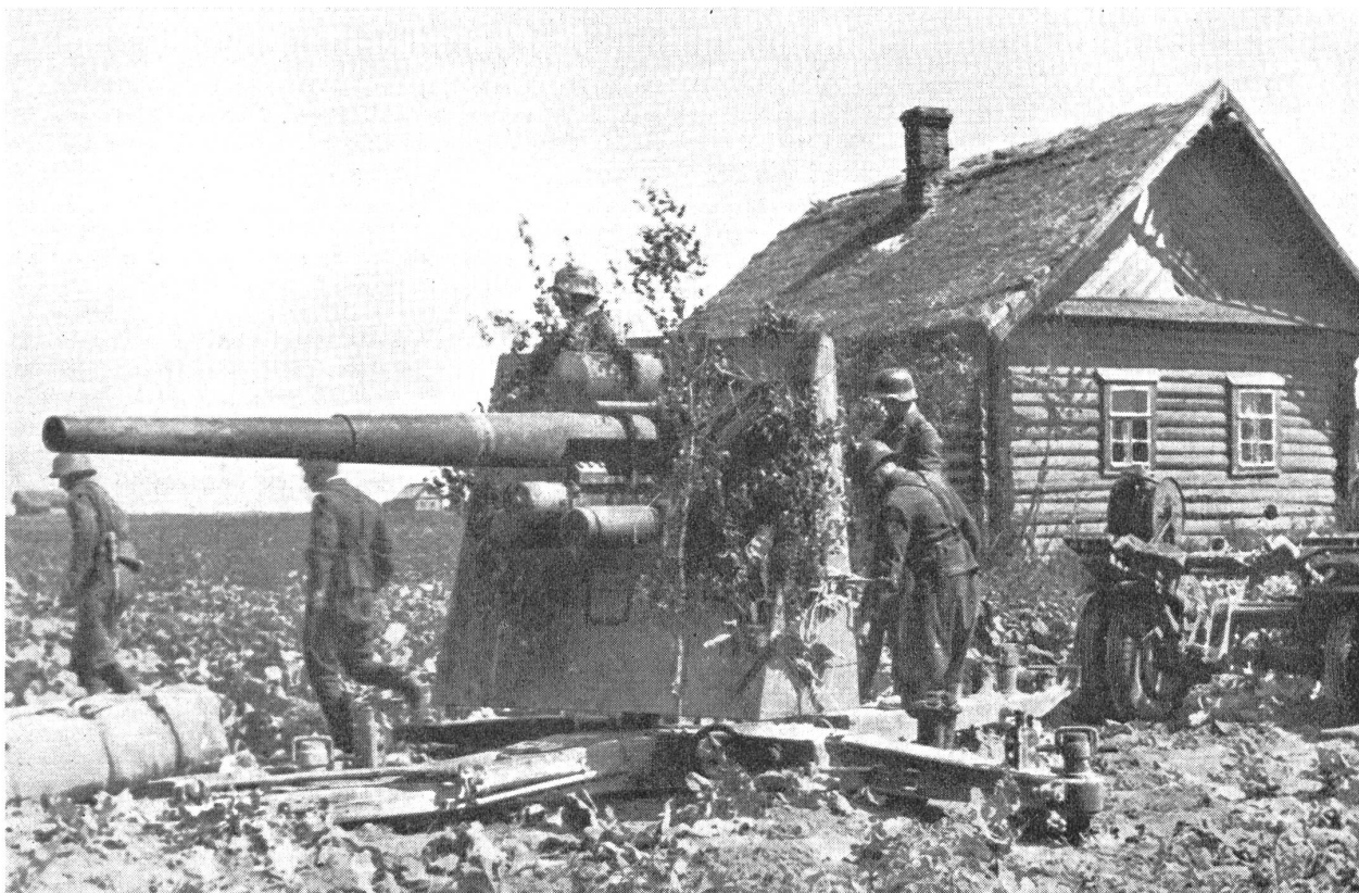
Deutsches 8,8 cm schweres Flabgeschütz an der russischen Front. Der Schutzschild verhindert eine stärkere Gefährdung der Geschützbedienung bei Verwendung des Geschützes zur Panzerabwehr.

Dieser Grundsatz gilt heute mehr denn je für die Flab.-Artillerie, und in richtiger Erkennung der tiefen Wahrheit haben heute alle Staaten die Entwicklung von leistungsfähigen Kommandogeräten nach Möglichkeit gefördert.