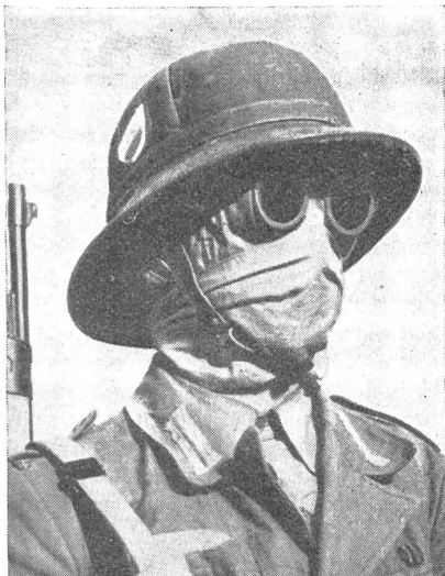
Geschützt gegen den Ghibli. — Protégé contre le Ghibli. — Al coperto del «Ghibli».

Sprengstoff: nach Anordnung des zugeteilten Sap.Of. (Schluß folgt.)