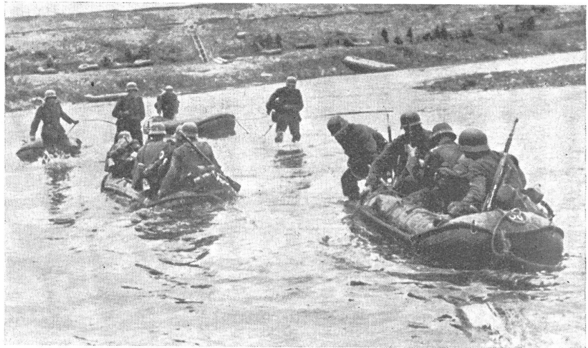
Uebersetzen von Infanterie durch Pioniere mittels Schlauchbooten. — Infanterie traversant une voie d'eau au moyen de bateaux pneumatiques conduits par des pionniers. — Trasporto di fanteria con pionieri mediante cannotti di gomma.

Es ist klar, daß in solchen Fällen eine unter einem energischen Kp.-Chef ein-