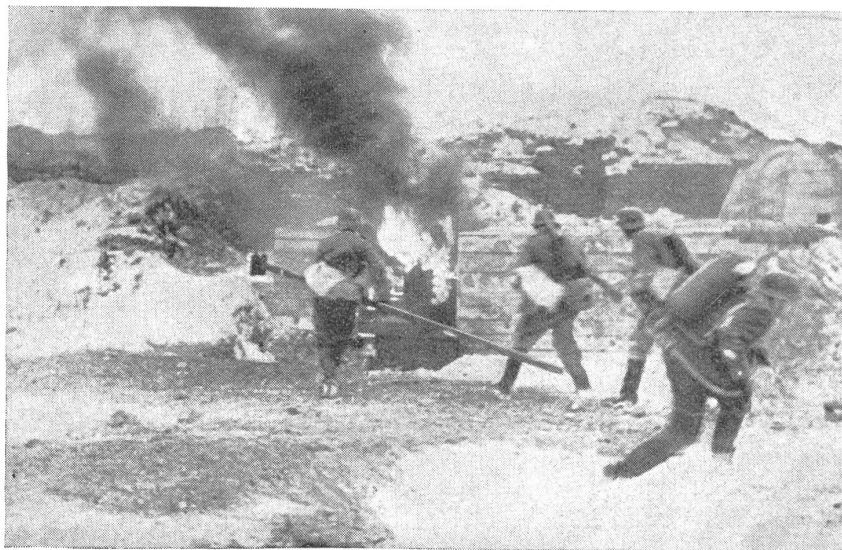
Pioniere im Angriff auf einen Bunker. — Pionniers à l'attaque d'un fortin. — Pionieri all'attacco contro un fortino.

Ein Zug ist eine so schwache Einheit, daß bei Ausfällen durch Krankheit, Wache, Urlaub usw., bzw. Verluste im Krieg, der gesamte Dienstbetrieb und die Kampfkraft stark beeinträchtigt würde.