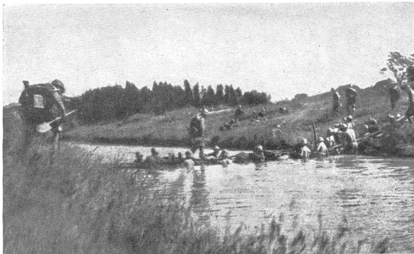
Japanische Infanterie beim Ueberschreiten eines Flusses über eine Notbrücke, die von Pionieren getragen wird. — Infanterie japonaise traversant un cours d'eau sur une passerelle provisoire portée par des pionniers. — Fanteria giapponese al passaggio di un fiume su un ponte di fortuna portato da pionieri.

Die mannigfaltigen Aufgaben, die uns der heutige Krieg allein schon in technischer Hinsicht stellt, können unmöglich von der Genietruppe allein (kurz genannt Pioniere) bewältigt werden. Nicht etwa daß unsere Pioniere keine ausgesprochenen Kämpfer wären, bekanntlich greifen sie oft als selbständige Verbände in den eigentlichen Infanteriekampf ein, sondern die Aufträge treten in ihrer Reichhaltigkeit zeitlich und räumlich so verschieden und so getrennt an uns heran, daß die Genie-Abteilungen der Division im Handumdrehen zersplittert würden. Ein zusammengefaßter Einsatz wäre in nützlicher Frist kaum mehr denkbar, eine