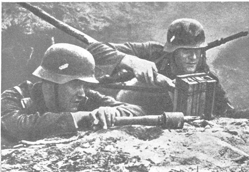
Deutscher Pionierleutnant in Sturmbereitschaft. — Lieutenant de pionniers allemand prêt à l'action. — Tenente tedesco dei pionieri, in prontezza d'assalto.

Schwerewichtsbildung rein unmöglich. In diesen Zusammenhang erlaube ich mir einen interessanten Vergleich zwischen deutscher und französischer Auffassung über Kampfaufgaben von Pionieren anzustellen. Dies nicht zuletzt, um die von uns beschrifteten Wege zu verstehen.