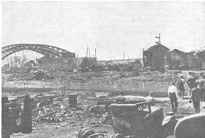
Auf dem Trümmerfeld von Rostow.

Mit der Dunkelheit beginnt ein fückisches Schießen aus Häusern und Kellern. Wir igeln mit unsern Panzerwagen und riegeeln gewonnene Stadtteile ab. Plündernde Zivilisten huschen vorüber, verschwinden in Eingängen und Höfen. Mündungsfeuer blitzt auf. Maschinengewehre der Infanteristen, die im Laufe des Tages nachgestoßen sind, hämmern. Der Feind hat sich in den Südtel der Stadt zurückgezogen und neu verschanzt. Wie Brandfackeln leuchten rotlodernde Gebäude. Eine ungeheure Detonation überspringt die fiebernde, schreiende, stöhnende, verwundete Halbmillionenstadt am Don. Ein gewaltiger Häuserblock ist auseinandergesprungen, von den Sowjets gesprengt.