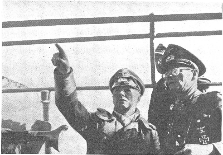
Feldmarschall Rommel — der Mann der Ueberraschungen. — Le maréchal Rommel, l'homme des surprises.

Ausgezeichnet zur Anbringung von Kriegslisten eignet sich der Wüstenkrieg . Die durch die Hitze und die ungewohnten äußeren Lebensbedingungen überreizten Nerven sind die Vorbedingungen dafür, daß man viel eher auf einen «Rohstäuscherkniff» des Gegners hereinfällt als vielleicht anderswo. Dazu kommt noch, daß der Luftaufklärung eine überragende Bedeutung zukommt, und weil die Sicht durch die hitzegesättigte Luft erschwert ist, fällt es leichter, den Gegner am langen Seil herumzuführen. So haben sich die Deutschen beispielsweise daran erinnert, daß ihnen durch den Versailler Vertrag Panzerwagen verboten worden waren. Die Uebungen der Reichswehr mußten mit Trankatrappen durchgeführt werden: mit Karton und Holz verkleidete Lastwagen spielten die Rolle der heutigen Panzerumföme. Diesen Streich spielte man nun den Briten: man täuschte große Panzeransammlungen durch Verwendung von Attrappen vor und lenkte dadurch den Gegner von den eigentlichen Absichten ab.