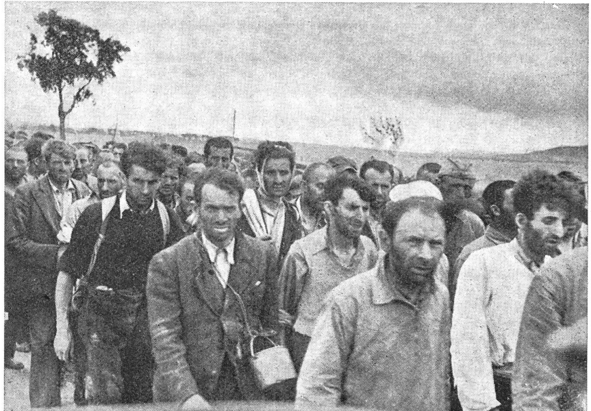
In Gefangenschaft geratene Partisanen werden in Gefangenenlager abgeführt. Völkerrechtlich fallen sie unter den Begriff von Franc-tireurs, die bekanntlich darauf gefaßt sein müssen, erschossen zu werden, wenn ihre Aktivität als erwiesen gilt.