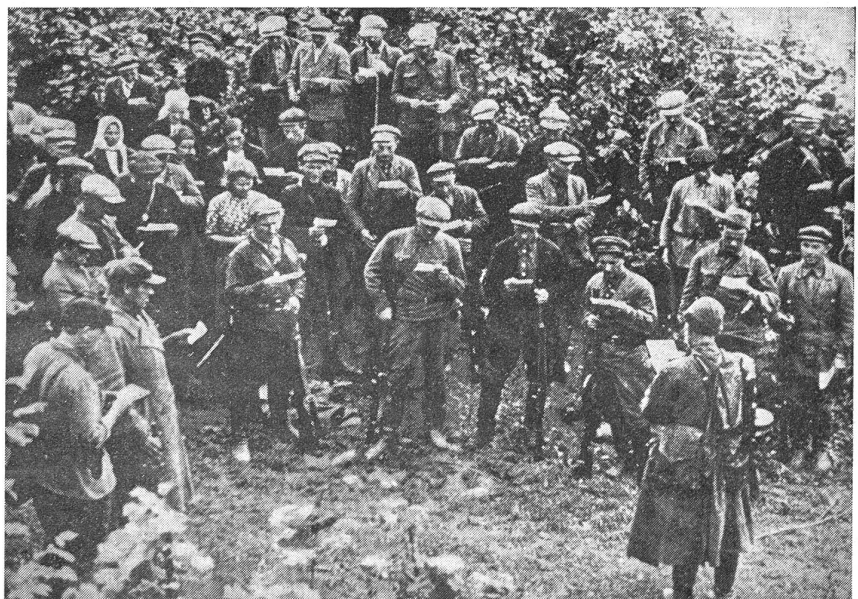
Eine Partisanengruppe nimmt Instruktionen entgegen. (Man beachte die Frauen, die im Trupp mitkämpfen.)

Ihre Kameraden, die den Wald nach Westen abriegeln, liegen indessen in rasch aufgeworfenen Erdbunkern. Tagaus, tag-ein, denn eine Ablösung ist hier nicht möglich. Eng schmiegen sich die kleinen Unterstände an die Kusseln an, so daß von der Höhe aus nichts zu sehen ist. Für den Kompagniegefechtsstand hat man sogar einen alten Dachgiebel aus dem nächsten Dorf abgetragen. Er steht nun auf der Erde als ein festes, hölzernes Zelt mit schrägen Fenstern darin. Ein kleiner Eckraum, zwei Meter im Geviert, ist für den Kompagnieführer abgezirkelt, mit einer Bank, auf der sich auch schlafen läßt, einem Tisch und — seltene Kostbarkeit — einer Tischdecke, die der Leutnant immer für sich mit sich