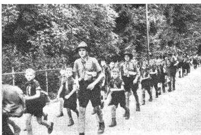
Aufmarsch der Wölfe

Schon in den frühen Morgenstunden rief die Tagwache die Pfadfinder zum ras-