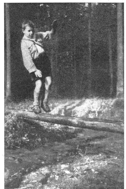
Über dem «Abgrund»