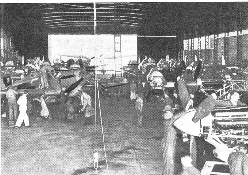
Wenn sich die Tore der Werkhalle öffnen, dann gelangt das reparaturbedürftige Flugzeug mit einem Schläge aus dem grauen Altertum der Wüste in das moderne 20. Jahrhundert.

In erster Linie ist der intensive Kampf gegen den deutsch-italienischen Nachschub zu erwähnen. Ununterbrochen hämmerte während 120 Tagen die alliierte Luftwaffe auf die nordafrikanischen Nachschubhäfen — fast täglich wurden in den Communiqués Benghasi und Tobruk genannt. Daß auch die Seefeste Malta ihren Stachel wieder hervorließ, das beweist der zweite General-Luftangriff dieses Jahres auf diese Insel. Und die britischen Luftangriffe auf die norditalienischen Städte fügen sich ausgezeichnet in diesen strategischen Rahmen ein. Seit Wochen war auch in der Nähe der Kampfzone eine starke Lufttätigkeit zu