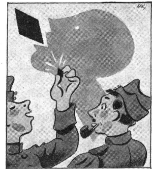
So ist's recht, so gibt es keine Erkältung und keinen Raucherkatarrh. Gaba beugt vor.