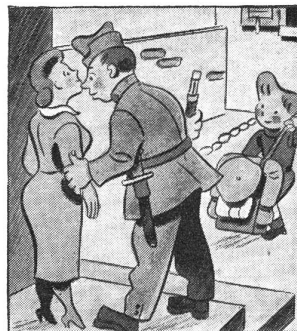
„Gelt, gib Sorg zu Dir, die kalten Nächte tun Dir nicht gut. Dass Du mir auch nur nicht zu viel rauchst!“