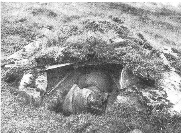
Getarntes Erdloch, von der dem Feinde abgekehrten Seite gesehen; durch einige wenige weitere Rasenziegel kann nötigenfalls auch noch der Einschluß gegen Luftbeobachtung von hinten getarnt werden. (Zens.-Nr. VI Vi 11622.)