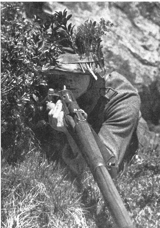
Gute, dem Gelände geschickt angepasste Tarnung durch Helmüberzug und Buschwerk. (Zens.-Nr. VI Vi 11631.)