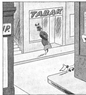
Gleich am nächsten Sonntag soll er ein Päckli haben. „Wenn ich nur wüsste, was er mag: Cigaretten, Stumpen oder Tabak?“