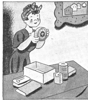
„Von jedem etwas. Und dazu eine grosse Schachtel Gaba, die ist so wieso recht.“