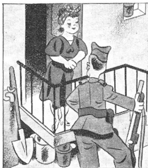
Die beiden kennen sich noch nicht lang — aber es hat doch einen ausführlichen Abschied gegeben, als er einrückte.

Der bekannte Luftsachverständige Peter Masfield äußerte sich im «Spectator» vom 25. September wie folgt über den Luftkrieg: «Beim letzten Großangriff auf London am 1. Mai 1941 kamen insgesamt 400 deutsche Flugzeuge zum Einsatz, die knapp über 420 Tonnen Bomben abwarfen. Bei jedem ihrer «mittelgroßen» Angriffe, die von rund 200 Flugzeugen durchgeführt werden, führt die R.A.F. heute mehr als 450 Tonnen Spreng- und Brandbomben mit sich, dabei in letzter Zeit häufig Sprengbomben im Gewicht von 4000 und 8000 lbs. Dieser Unterschied ist darauf zurückzuführen, daß die großen englischen Bomber zwischen 13,000 und 17,000 lbs (6 bis 8 Tonnen) Nutzlast mitnehmen können, während der schwerste deutsche