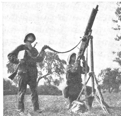
Im Bewegungskrieg werden die Flab-Mg. der Infanterie grundsätzlich nach allen Seiten hin offene Feuerstellungen beziehen. (Zens.-Nr. VI R 11659.)

Das Ziel der technischen und taktischen Ausbildung in der inf. Flab ist es deshalb, die Infanterie zu befähigen, Abschüsse zu erzielen. Da das Zielverfahren (Kreiskorn) sich von den normalen Zielverfahren wesentlich unter-