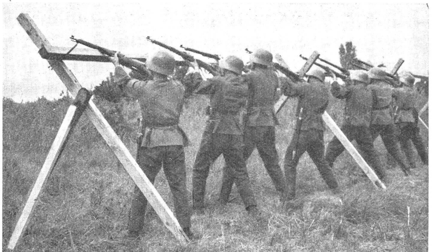
Die Fliegerabwehr mittels Gewehr und Karabiner hat nur dann Aussicht auf Erfolg, wenn eine Mehrzahl dieser Waffen gleichzeitig auf das gleiche Ziel eingesetzt werden kann. (Zens.-Nr. VI R 11658.)

Die meisten modernen Kampfflugzeuge, mit deren Mitwirkung am Erd-