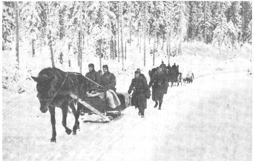
Deutscher Kp.-Küchentrain auf dem Marsch nach vorne.

Wo sind die marschierenden Kolonnen geblieben, wo die Staubbahnen und die rollenden Räder der holpernden Wagen? Ruhig und still geht der Verkehr vor sich. Schwere Pferde ziehen die großen Schlitten, die heute neben den unaufhörlich vorüberdonnernden Lastwagen das Bild bestimmen. Nicht mehr die grauen Ge-