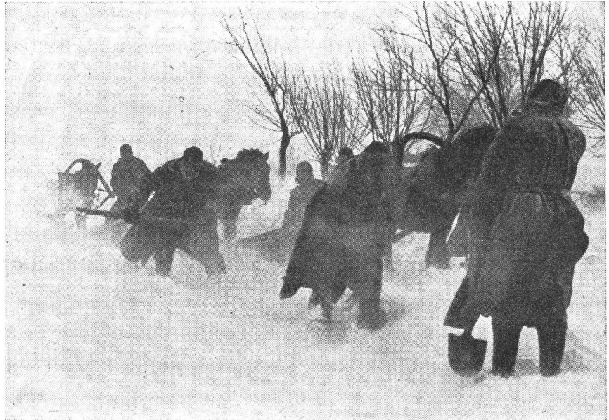
Der Sturm hat die Straße verweht, wiederum muß zu Schaufel gegriffen werden, um die Straße frei zu machen und den Nachschub nach vorne zu bringen.

Von Kilometer zu Kilometer wechselt das Bild, dessen Grundthema doch immer das gleiche bleibt: Nachschub! Ueber allem